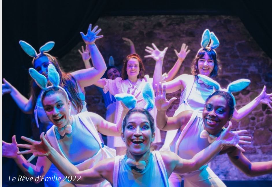
Le Rêve d'Emilie 2022